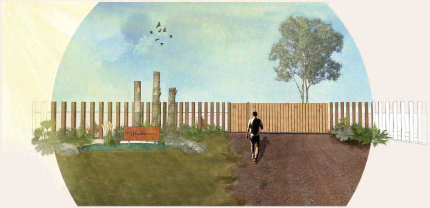
PORTAL DE ACCESO